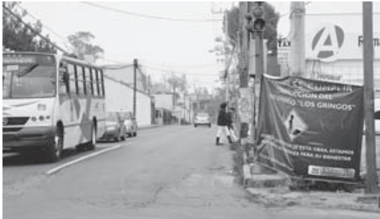
ANTE EL CIERRE DE LA VIALIDAD la Dirección de Seguridad Pública y Tránsito Municipal realizará adecuaciones viales.

• Serán beneficiados miles de habitantes de Bosques del Lago, Bosques de Morelos, 3 de Mayo, El Tikal y Ejidal San Isidro