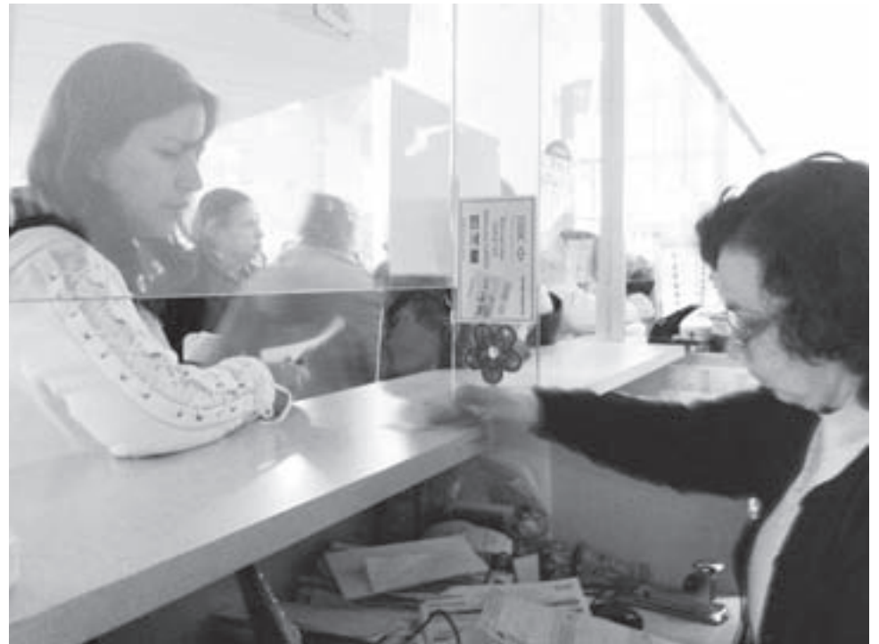
LA RESPUESTA CIUDADANA permitirá a la dependencia y al gobierno local continuar con la reducción de esta contribución.

Por lo anterior hizo un exhortó a la ciudadanía a utilizar el vital líquido de manera responsable e impulsar y cultivar el uso eficiente del vital líquido en todas las actividades