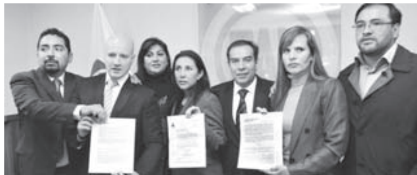
REGIDORES DE OPOSICIÓN PIDEN en su demanda iniciar un procedimiento administrativo disciplinario en contra de la Alcaldesa.