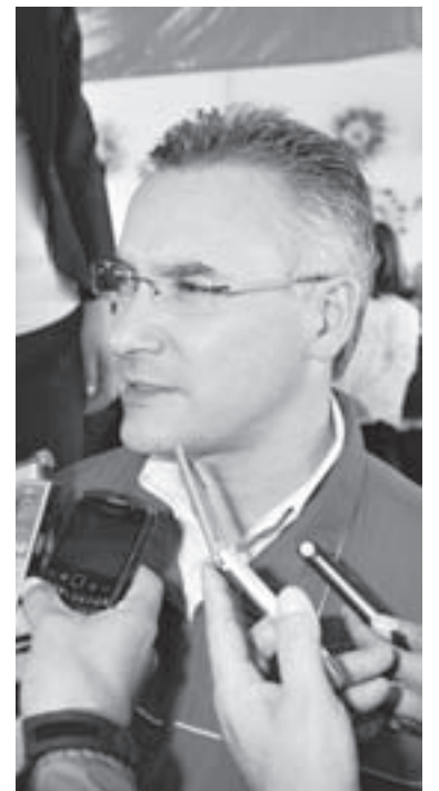
EL DIPUTADO MANIFESTÓ que se busca reducir la brecha digital y pasar a una economía basada en el conocimiento.

“La reforma al artículo 5to constitucional fue realizada para incluir el deber del Estado de invertir en Ciencia y Tecnología y ahora, siendo una obligación ya lo vemos reflejado en políticas públicas del Gobernador del Estado de México, Eruviel Ávila Villegas, con el anuncio de 174 mil becas para alumnos de alta calidad educativa”, señaló.