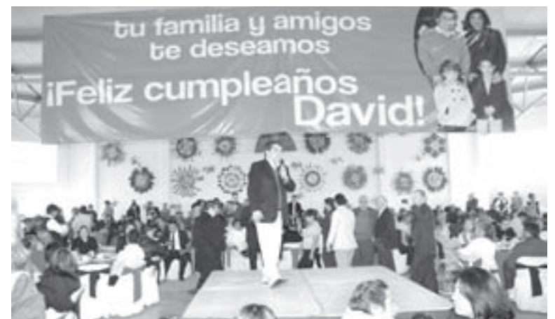
EL ASPIRANTE CONSIDERÓ necesario hacer uso de la experiencia de los políticos priístas, que toda la vida han participado y nunca se les ha considerado.