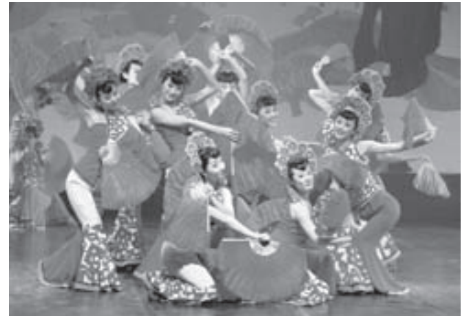
EL CUPO PARA ASISTIR a la presentación del Ballet Folclórico de Shanxi que iniciará a las 18 horas, será limitado.

En esta ocasión dedicará a la audiencia mexicana una gran variedad de danzas, no sólo de la región de Shanxi, sino de todo el norte de China.